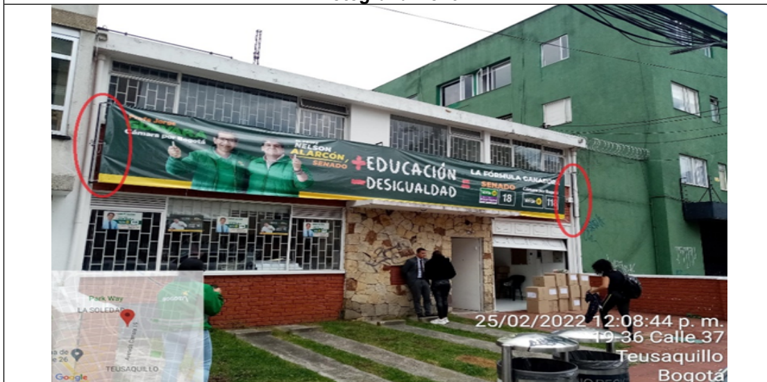
Foto No. 3 En el cual se evidencia que el elemento tipo Aviso supera el antepecho, así mismo se observa que se encuentra volado de la fachada y alcanza a cubrir parte de las ventanas del segundo nivel.