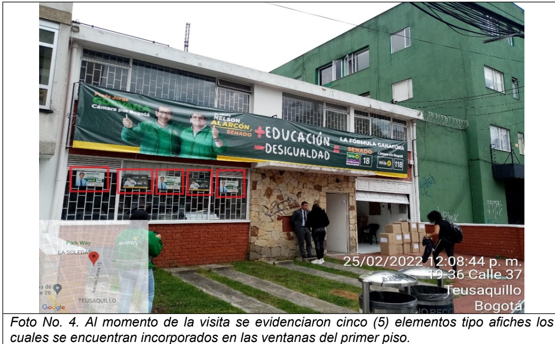
Foto No. 4. Al momento de la visita se evidenciaron cinco (5) elementos tipo afiches los cuales se encuentran incorporados en las ventanas del primer piso.